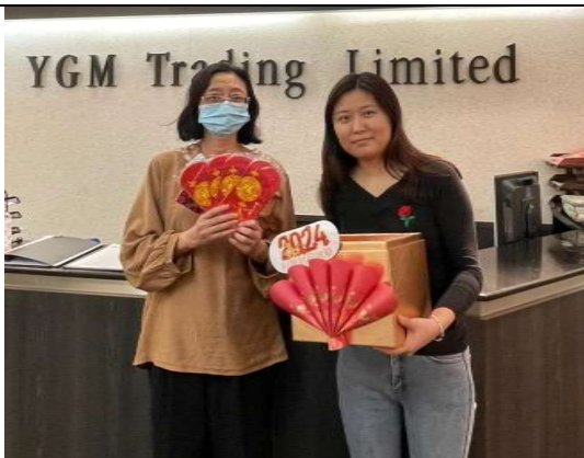
利是封回收重用大行動 2024