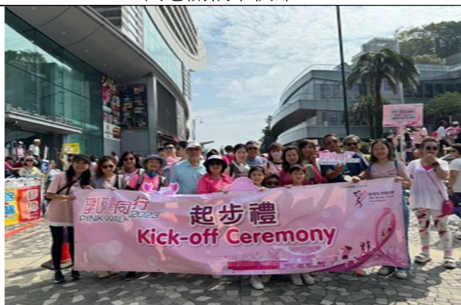
乳健同行 2023 - 步行籌款，並向香港乳癌基金會捐贈港幣 7,150 元現金